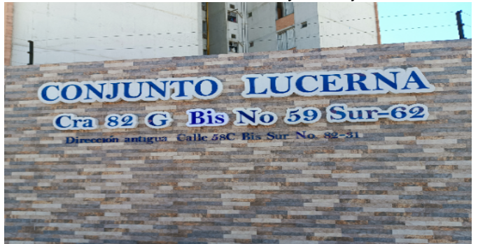
Nomenclatura Inmueble y/o Conjunto