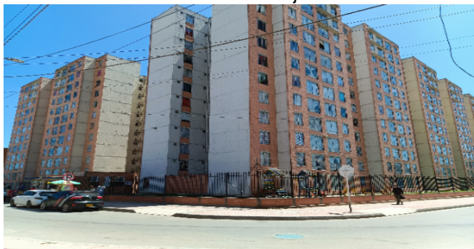
Fachada del Conjunto