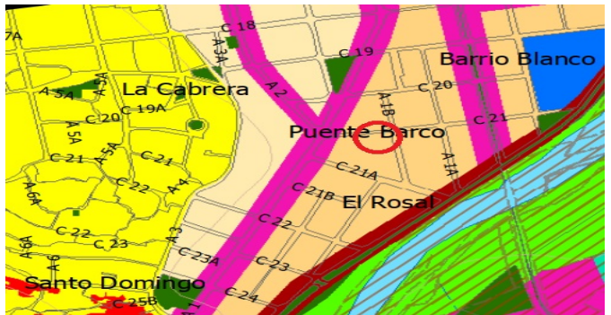
Plano de usos