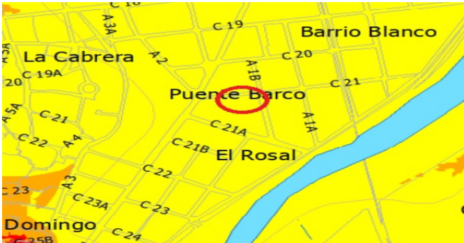
Plano remoción masa