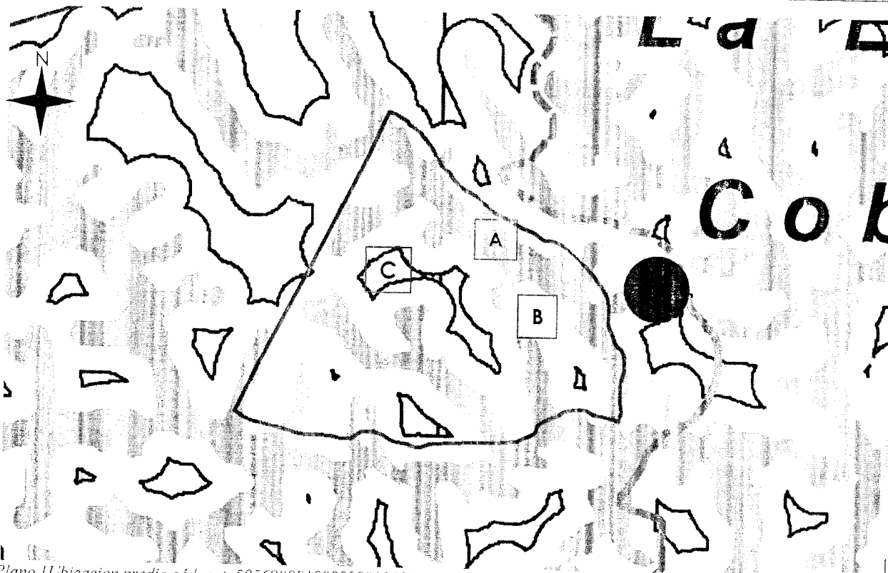
Plano Ubicación predio cód. cat. 505680001000000010608000000000