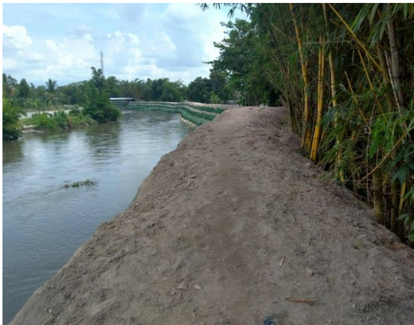
Zonas críticas de inundación