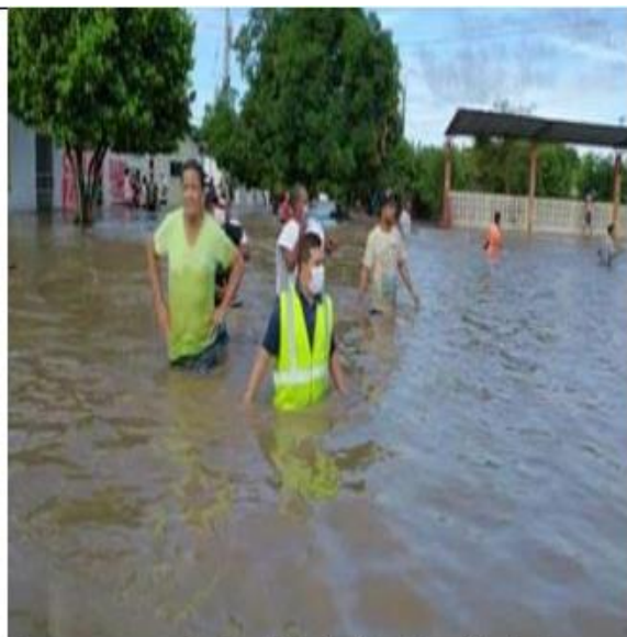
imagen: caracterización de Barrios afectados