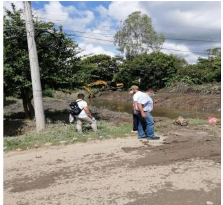
Caños, fuente de inundación del Municipio de Fundación