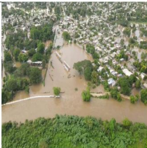
imagen: caracterización de Barrios afectados