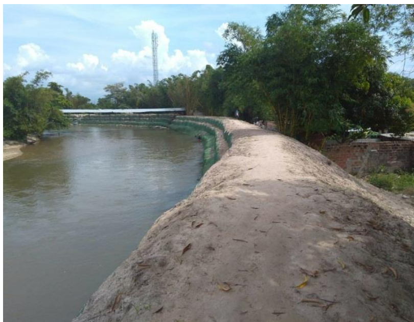
Zonas críticas de inundación