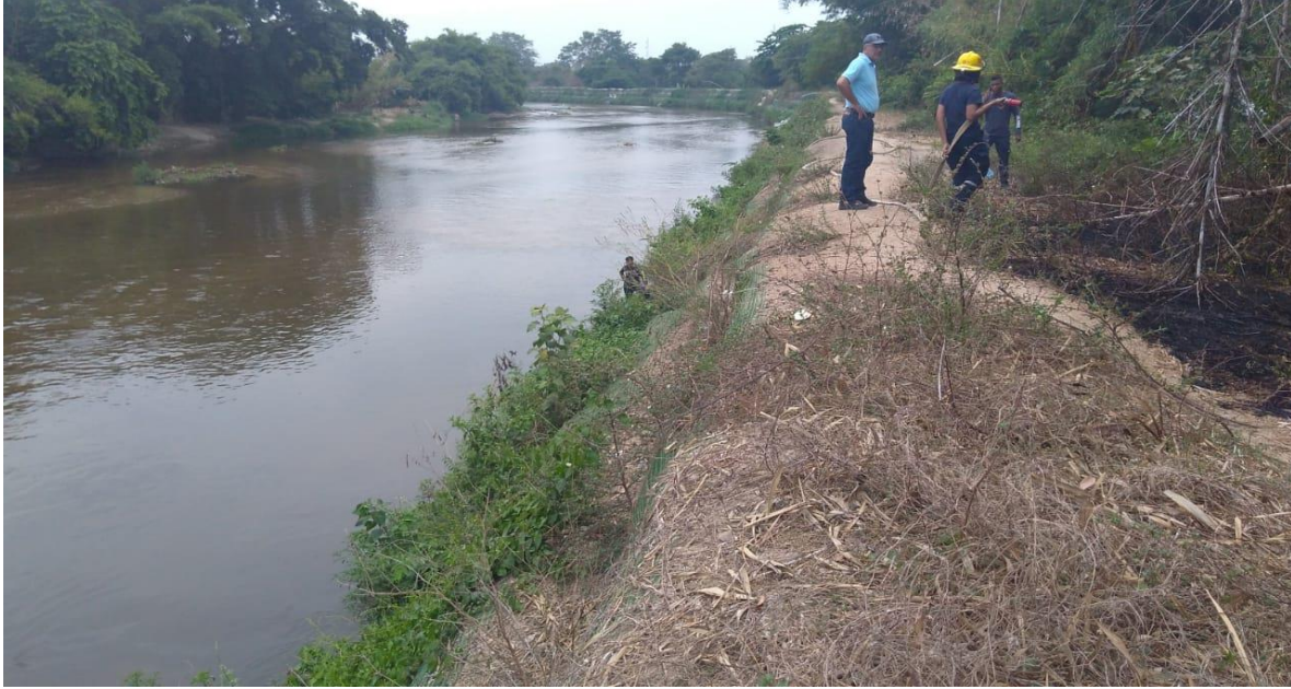
Zonas críticas de inundación