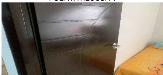
PUERTA ALCOBA 1